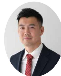
株式会社 KYW 代表取締役